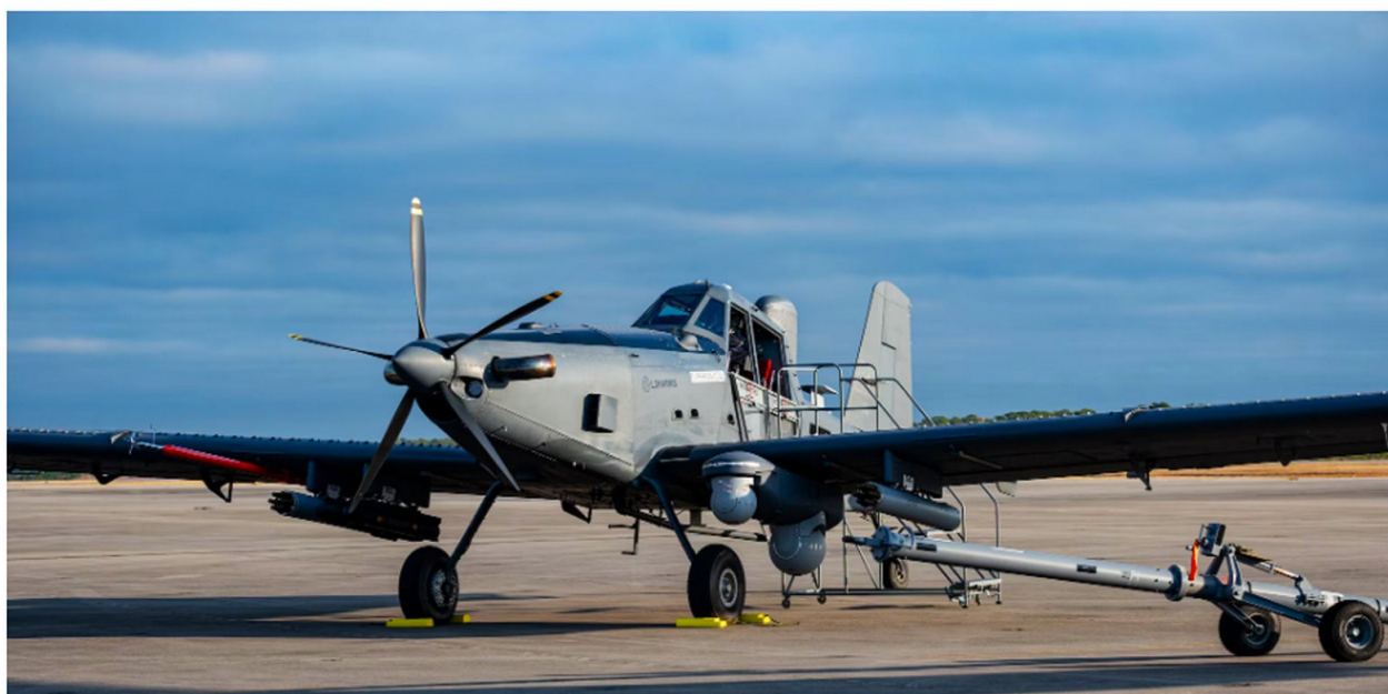
Air Tractor L3Harris AO-1K Skyraider II. No sítio eletrônico da Air Tractor; é designado como AT-802U SkyWarden (U.S. Air Force, Air Force Special Operations Command).

Adequado notar que Abelardo de la Espriella citou uma aérea de aproximadamente 330.000 hectares de coca como foco de sua atenção. Em seus relatórios, o Escritório das Nações Unidas sobre Drogas e Crime (UNODC, United Nations Office on Drugs and Crime ) cita que, em 1994, o cultivo de coca englobava 44.700 hectares 6 . Em 1995, 50.900 hectares. Cinco anos depois, ou seja, no ano de 2000, o UNODC indicava que essa área mais do que triplicou, chegando a 163.000 hectares. Décadas depois, em seus levantamentos no ano de 2022, a área de cultivo totalizava 230.000 hectares, crescendo para 253.000 no ano subsequente. A região do Pacífico, conforme o relatório (UNODC) 7 de 2023 detinha