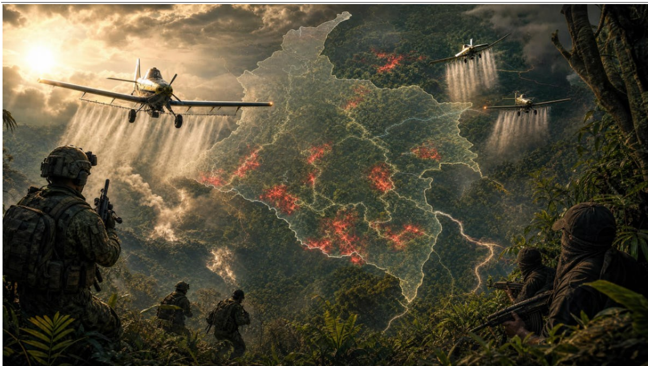
Imagem meramente ilustrativa, gerada por inteligência artificial.

F indo o pleito eleitoral na Colômbia, o presidente eleito Abelardo de la Espriella anunciou que, a partir de agosto de 2026, ordenará a fumigação aérea de aproximadamente 330.000 hectares de coca, bem como ataques aéreos para neutralizar acampamentos de insurgentes (ou melhor, narcoterroristas) e a destruição de embarcações ou aeronaves utilizadas no tráfico de drogas.