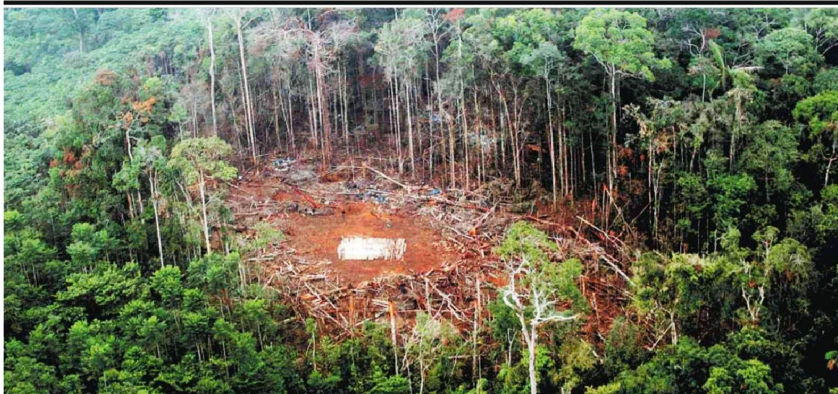
ALVONA SELVA - Vista área do acampamento das Farc bombardeado pelas Forças Armadas colombianas no lado equatoriano da fronteira; duas ondas de ataques devastadoras reduziram a cinzas base guerrilheira