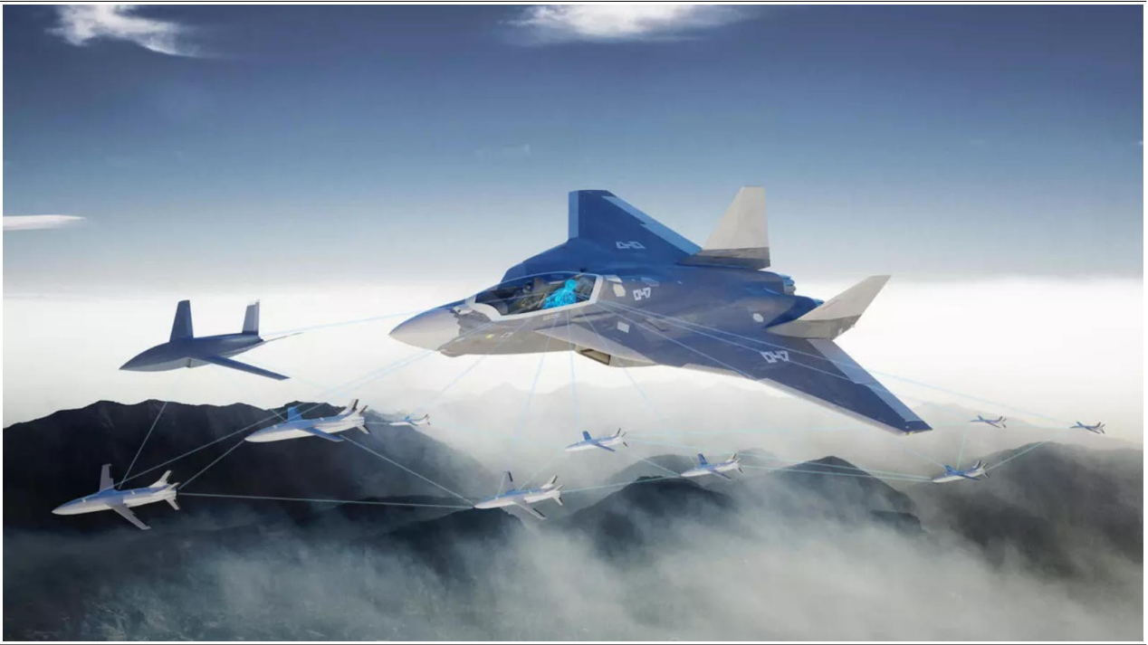
Sistema de Armas de Próxima Geração 6 (NGWS, em inglês). Nesse “sistema de sistemas”, caças de nova geração tripulados irão operar em conjunto com veículos remotos não tripulados, todos conectados a outros sistemas no espaço, no ar, em terra, no mar e no ciberespaço, por meio de uma nuvem de dados chamada “Nuvem de Combate” (Airbus).