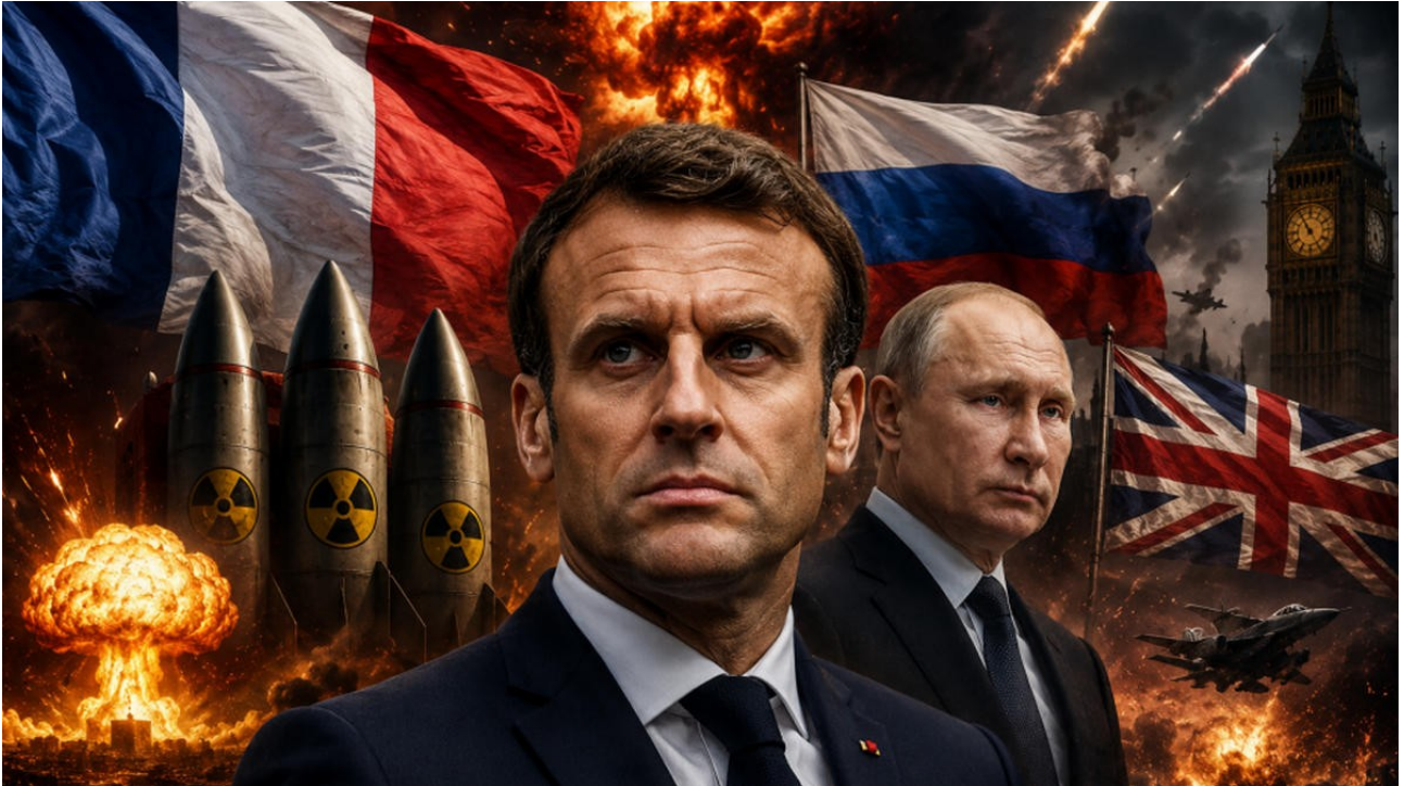
Imagem meramente ilustrativa, gerada por inteligência artificial.

“Nunca agir por paixão, mas por reflexão” – Baltasar Gracián, filósofo espanhol, Aforismo 189 da Arte da Prudência (Aconselha que o sábio avalia o perigo antes de se envolver, agindo com desconfiança e distanciamento perante pessoas de intenções duvidosas).