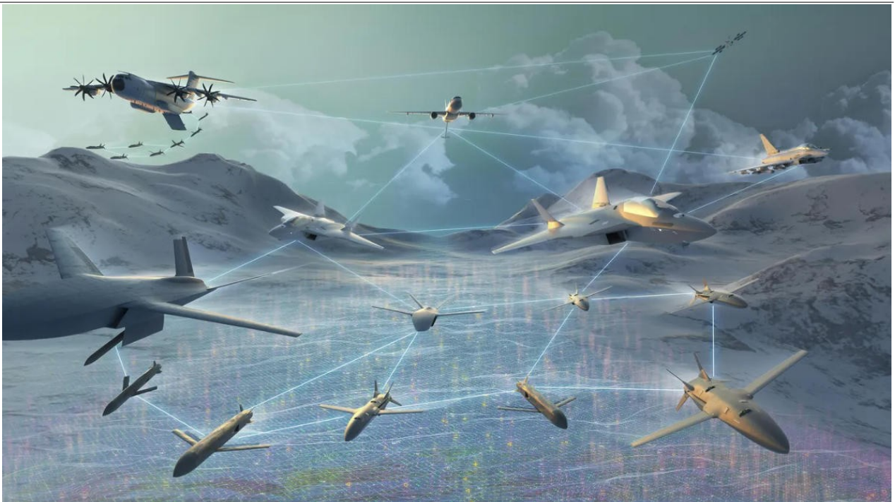
Os sistemas de transporte remoto, lançados de aeronaves como o A400M, darão suporte a aeronaves tripuladas com um alto grau de autonomia (Airbus).