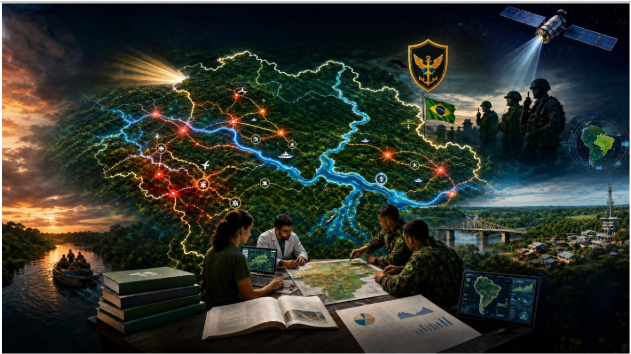
Imagem meramente ilustrativa, gerada por inteligência artificial.