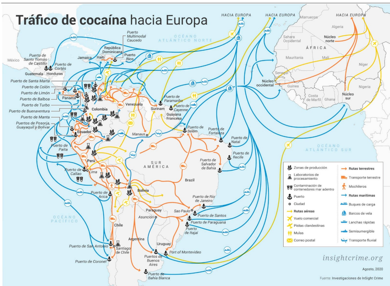
Figura 5: Rotas do Tráfico de Cocaína da América Latina para a África e Europa (UNODC, 2023).

De acordo com o relatório da UNODC (2023), a posição geográfica da África é importante no tráfico de drogas da América Latina para os continentes africano e europeu, por isso os portos de Recife, Natal, Fortaleza e Vila do Conde são considerados estratégicos, pois estão mais próximos da costa africana (figura 3). No entanto, o Porto de Santos é o maior exportador, por meio de estreitas relações de membros do PCC com integrantes das organizações mafiosas italianas Ndrangheta e Camorra.