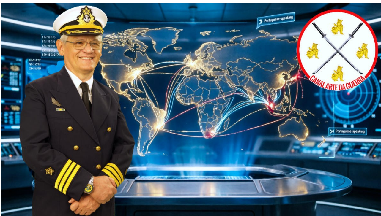
O Comandante Robinson Farinazzo, em montagem gerada com apoio de inteligência artificial.

O lá Combatentes! O Canal Arte da Guerra, liderado pelo capitão-de-fragata da reserva da Marinha do Brasil, Comandante Robinson Farinazzo, chega aos 10 anos consolidado como um dos maiores canais brasileiros especializados em geopolítica, defesa, soberania nacional e análise estratégica internacional.