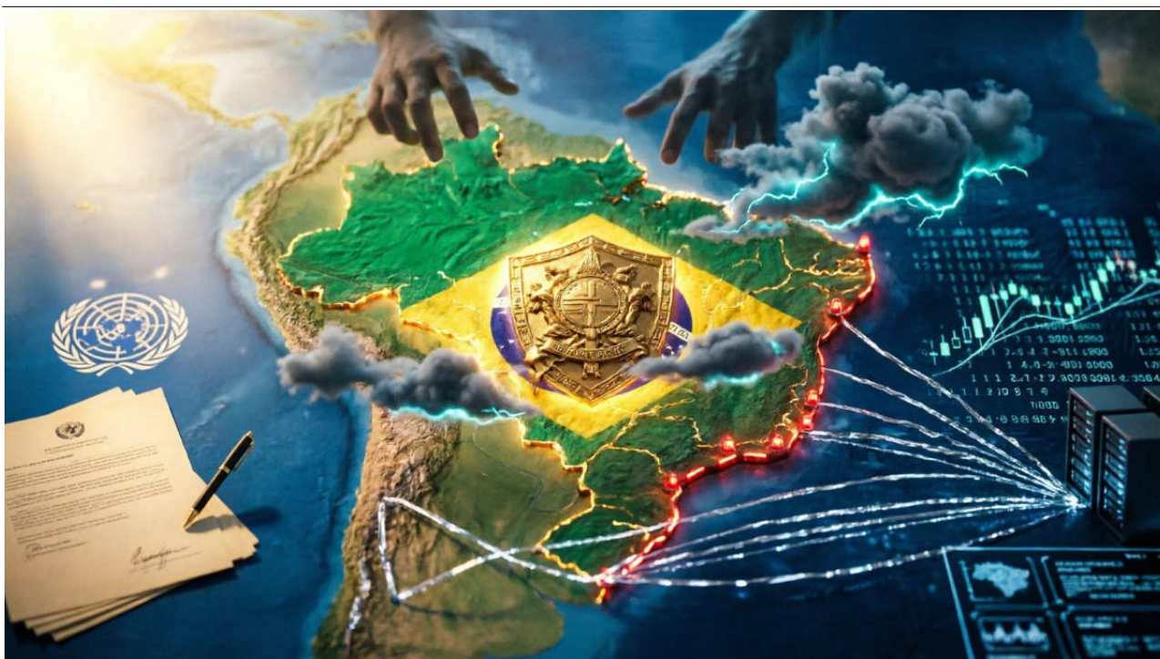
Imagem meramente ilustrativa, gerada por inteligência artificial.

É sabido que este não é o pensamento de todos, mas é necessário fazer algumas considerações sobre os recentes acontecimentos. Em uma live no Canal Arte da Guerra, sobre o conflito no Equador, quando estourou o embate entre o crime organizado e as forças federais, mencionamos que aquilo possuía características de um balão de ensaio para uma espécie de “Operação Condor 2.0”: o crime organizado sendo utilizado como justificativa ou instrumento para futuras intervenções.