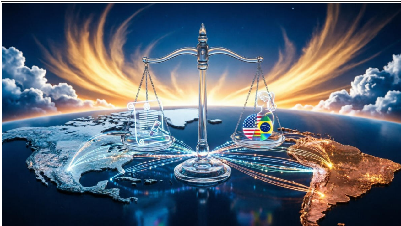
Imagem meramente ilustrativa, gerada por inteligência artificial.

O presente artigo analisa preliminarmente as implicações jurídicas, políticas e estratégicas da eventual classificação de organizações criminosas brasileiras como entidades terroristas pelo governo dos Estados Unidos.