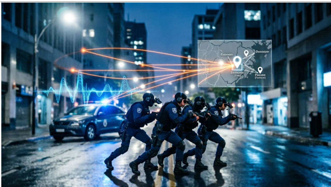
Imagem meramente ilustrativa, gerada por inteligência artificial.