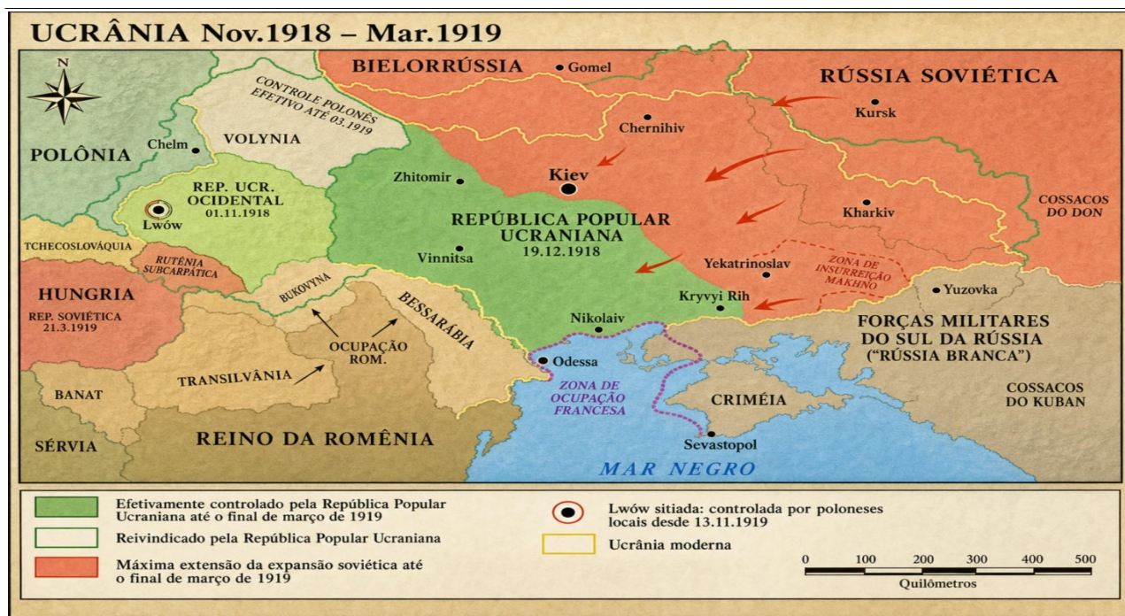
Mapa 2: Situação da Ucrânia 1918-1919.

Esse sonho alemão criou vários estados: Ucrânia, Reino de Regência da Polônia 7 , Lituânia, Ducado da Curlândia 8 e Semigália, Finlândia e Estônia (sem falar no Azerbaijão, Geórgia e Armênia 9 no Cáucaso). Mas esse sonho duraria pouco. Lênin e Trotski sabiam disso como ninguém, porque esses Estados-satélite não tinham sustentação, pelo menos não como a Alemanha queria, já que estava sendo derrotada na frente ocidental. Isso a levou à derrota, ao Armistício de Compiègne em 9 de novembro de 1918, e depois ao Tratado de Versalhes de 1919, e ela foi forçada a abandonar todos os territórios ocupados. Esse caos político e a desintegração do Império Russo deram lugar à Guerra Civil Soviética (1917-1922).