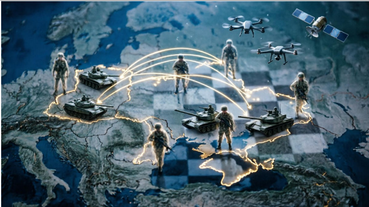
Imagem meramente ilustrativa, gerada por inteligência artificial.