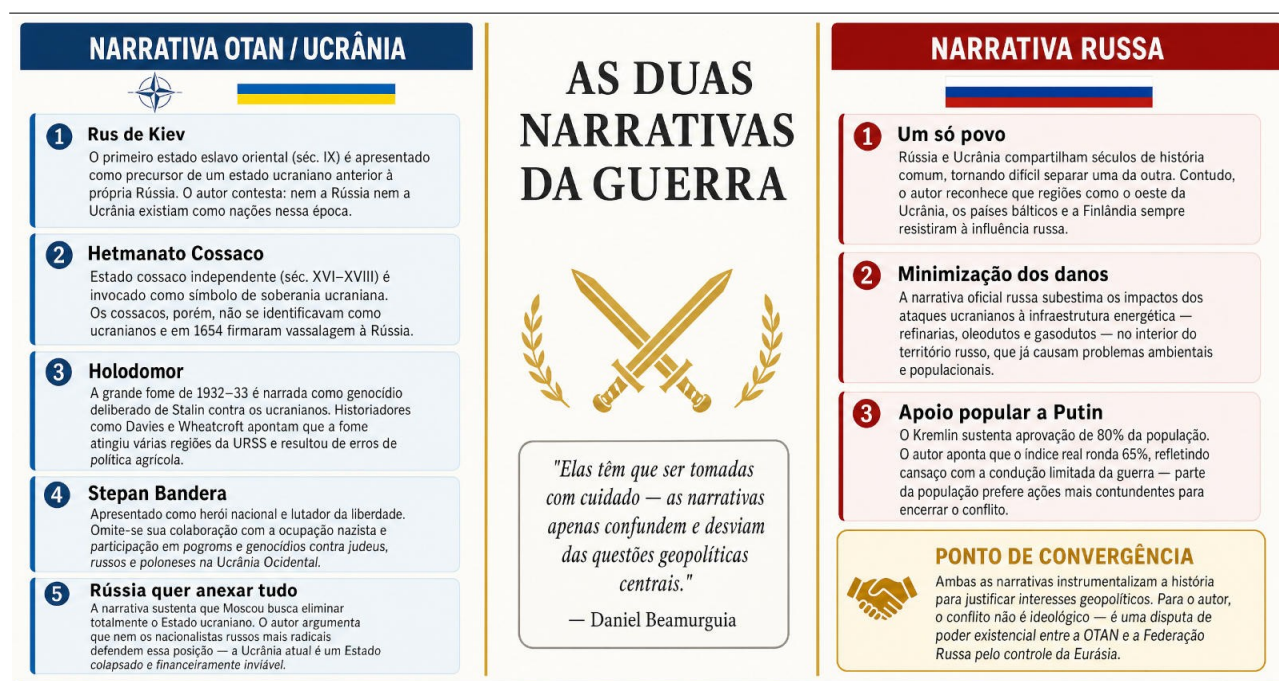
Infográfico 1: As narrativas russas e ucranianas. Ambas devem ser tomadas com cautela.

Elas são importantes para entender os interesses e as justificativas das partes do conflito, mas têm que ser tomadas com cuidado. De meu ponto de vista seriam as seguintes: