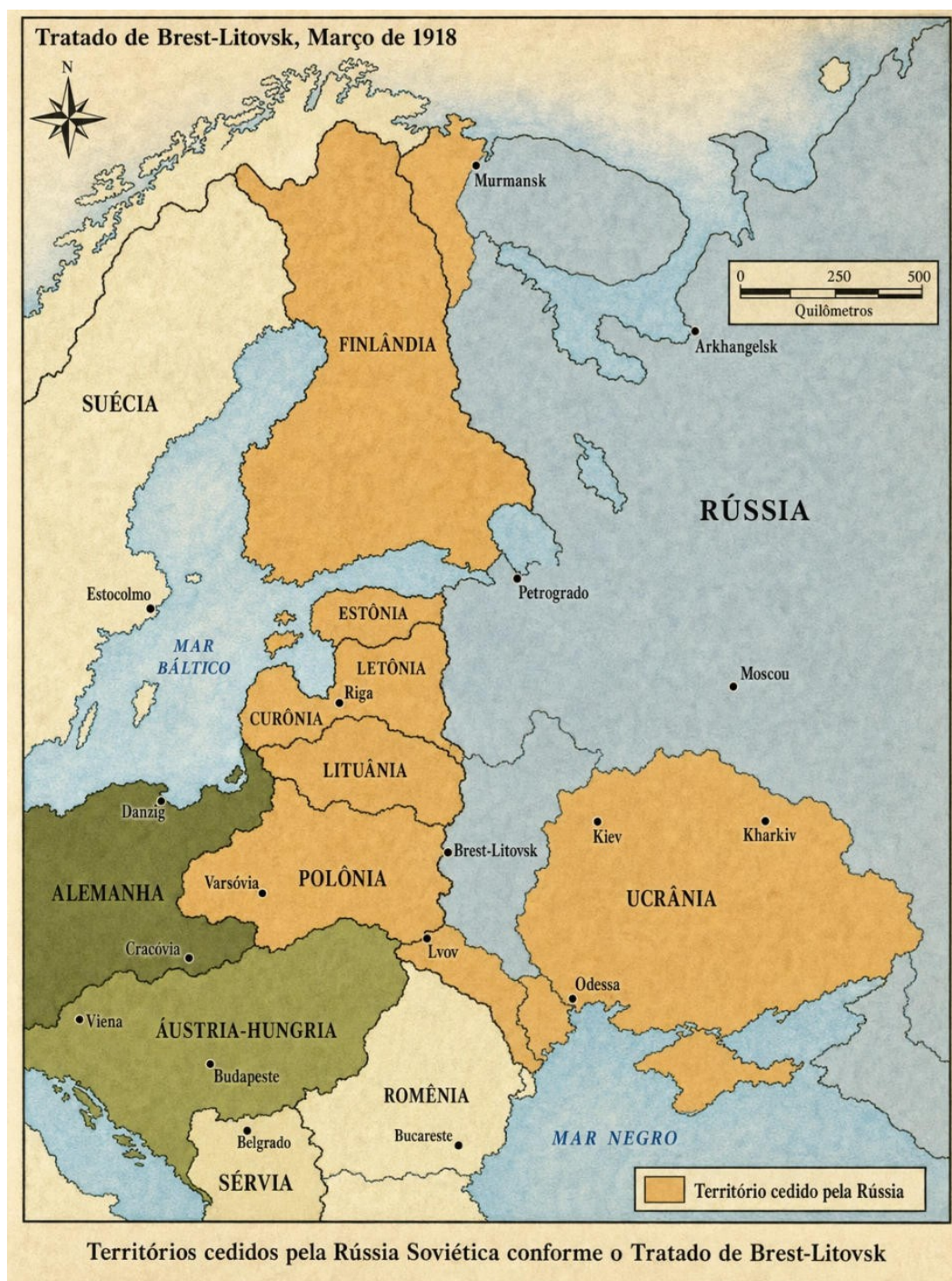
Mapa 1: A Mitteleuropa 6 , sonho molhado do Império Alemão do Kaiser Guilherme II, seria uma série de estados-satélites controlados pela Alemanha, fortalecendo e expandindo seu poder na Europa Oriental e ao mesmo tempo cercando e enfraquecendo a Rússia.

e perdeu territórios no leste da Polônia, na Bielorrússia, na Finlândia, no Báltico, na Ucrânia e no Cáucaso.