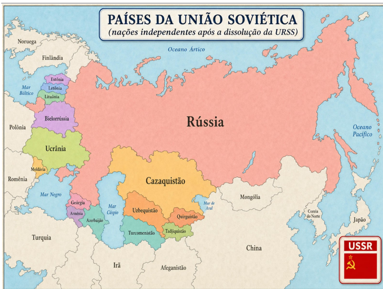
Mapa 3: Ex-repúblicas soviéticas em 1991.

Se analisarmos as fronteiras das ex-repúblicas soviéticas depois da desintegração da URSS em 1991, notaremos que surgem quase os mesmos estados do Tratado de Versalhes de 1919, porque nessa época essa era a divisão política dos estados do Leste Europeu que convinha às potências aliadas vencedoras, debilitando e cercando a Rússia. Em 1991, o fenômeno se repete, porém com a supremacia dos Estados Unidos, com a União Europeia assumindo um papel subordinado e coadjuvante. Diferente da Entente de Versalhes, mas com a mesma finalidade: dividir e enfraquecer a Rússia. Essa é uma constante histórica.