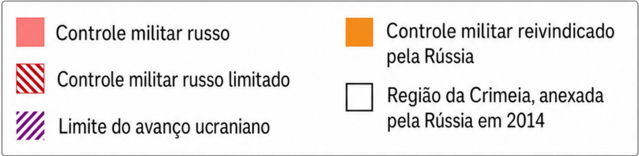
Mapa 5: Territórios ocupados pela Rússia na guerra da Ucrânia.

Quando a Rússia interveio diretamente na Ucrânia, foi uma surpresa para a OTAN. Tinha que reagir, senão a guerra podia terminar de maneira favorável à Rússia se Zelensky assinasse o Acordo de Istambul, reconhecendo as autonomias de Lugansk e Donetsk e a ocupação Russa da península da Crimeia. Mas Zelensky, como todo presidente ucraniano, não têm poder de decisão sobre coisa alguma, daí a ameaça do premiê britânico Bóris Johnson de retirar o apoio financeiro à Ucrânia se ele fizesse um acordo com a Rússia. Seria