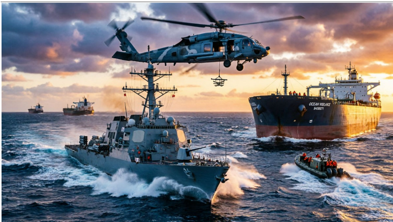
Imagem meramente ilustrativa, gerada por inteligência artificial.