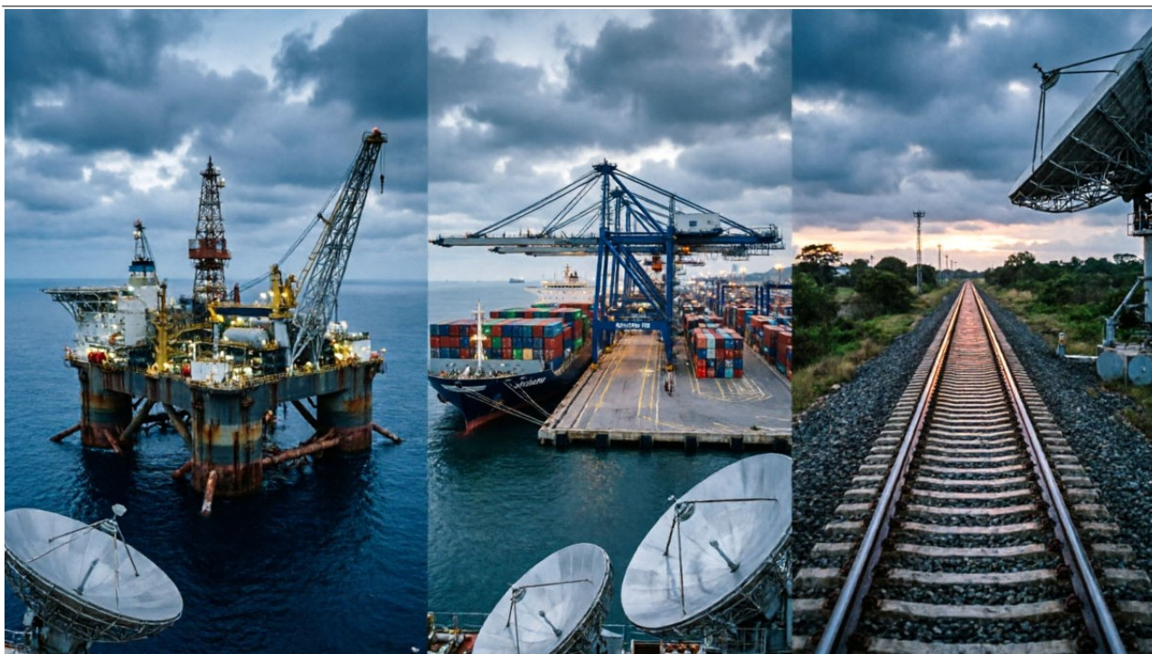
Imagem meramente ilustrativa, gerada por inteligência artificial.