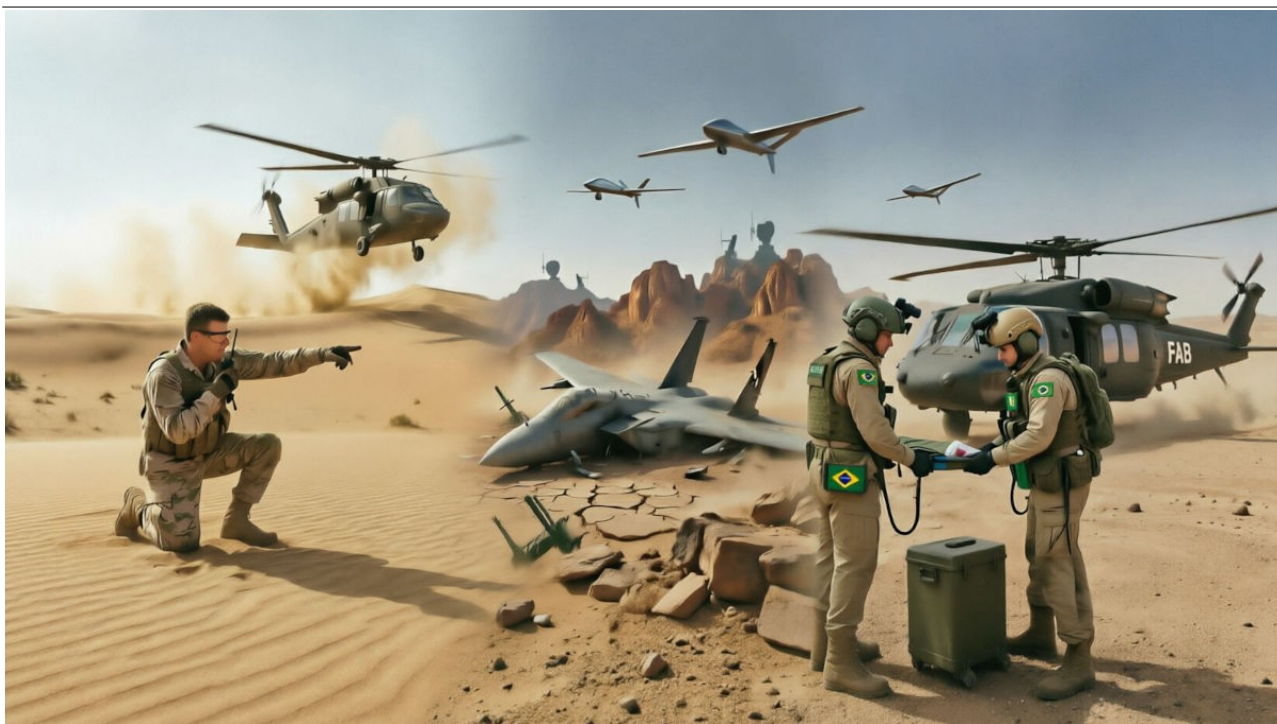
Imagem meramente ilustrativa, gerada por inteligência artificial.

“Ninguém fica para trás.” – Palavra de Ordem do PARA-SAR da FAB.