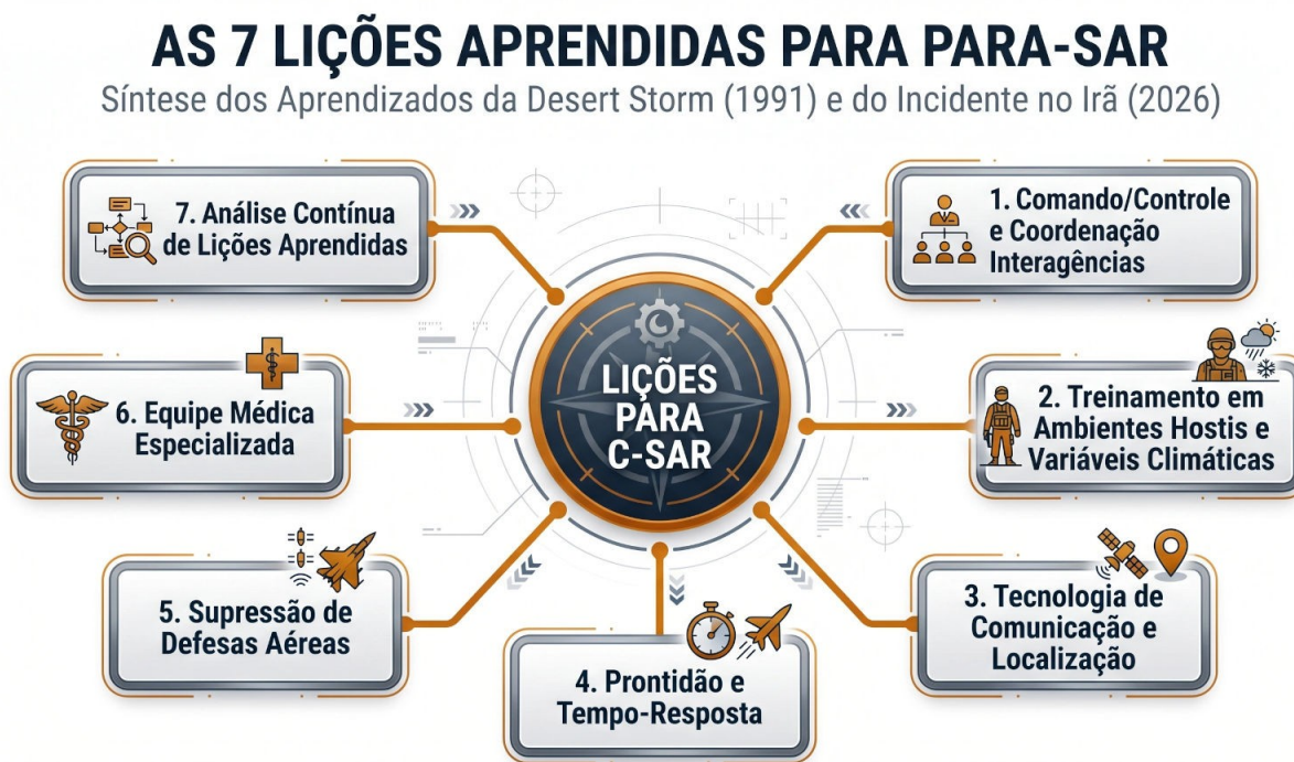
Diagrama radial sintetizando as sete lições estratégicas e táticas extraídas das experiências de resgate em combate (1991 e 2026), focadas no aprimoramento contínuo das capacidades operacionais do PARA-SAR.

Do quanto disposto até aqui, tem-se que as experiências de resgate em combate dos EUA na operação Desert Storm e no abate dos F-15, A-10 e helicópteros Black Hawk no sudoeste do Irã oferecem diversas lições para o aprimoramento contínuo do PARA-SAR da FAB.