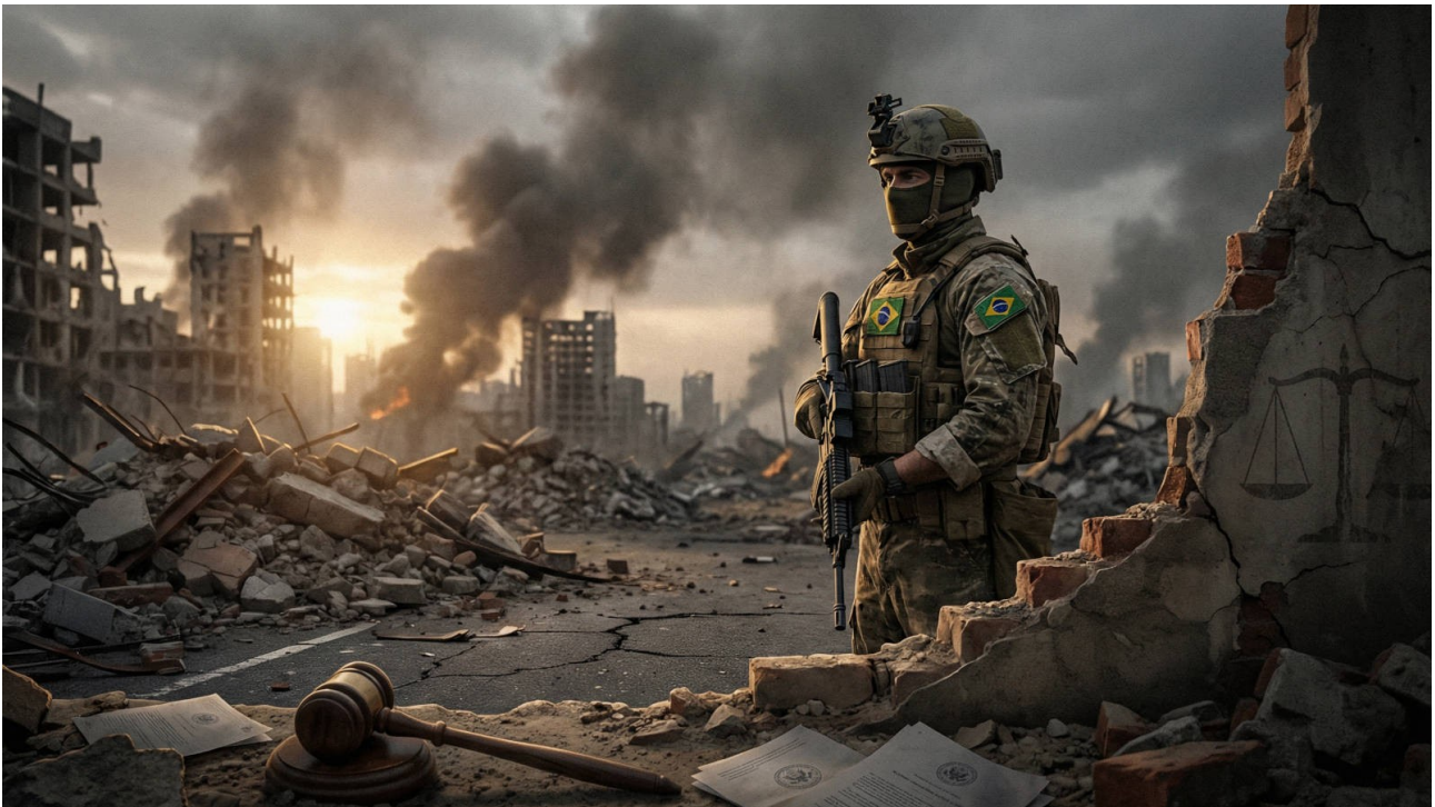
Imagem meramente ilustrativa, gerada por inteligência artificial.

E ste artigo, no atual contexto de mortes de brasileiros e de suspeita de tortura de uns contra os outros no estrangeiro, aborda a complexa questão de mercenários e de crimes militares, com foco nas definições legais internacionais, nas implicações para cidadãos brasileiros envolvidos em conflitos estrangeiros, como na Ucrânia, e na delimitação das competências jurídicas no Brasil. Analisamos a distinção entre combatentes legítimos e mercenários sob o Direito Internacional Humanitário (DIH) e a Convenção Internacional contra o Recrutamento, a Utilização, o Financiamento e o Treinamento de Mercenários, bem como as responsabilidades do Estado brasileiro diante dessas situações na prevenção da prática e na inclusão de tais penas em seu sistema jurídico-penal.