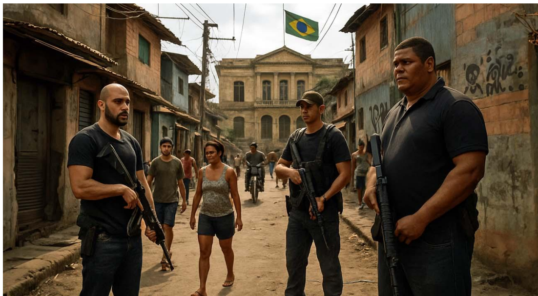
Imagem meramente ilustrativa, gerada por inteligência artificial.

O conceito de soberania, o poder supremo do Estado, enfrenta desafios crescentes no Brasil; a atuação de organizações criminosas, com alertas históricos de décadas, demonstra a persistência dessa ameaça à autoridade estatal e à vida cotidiana.