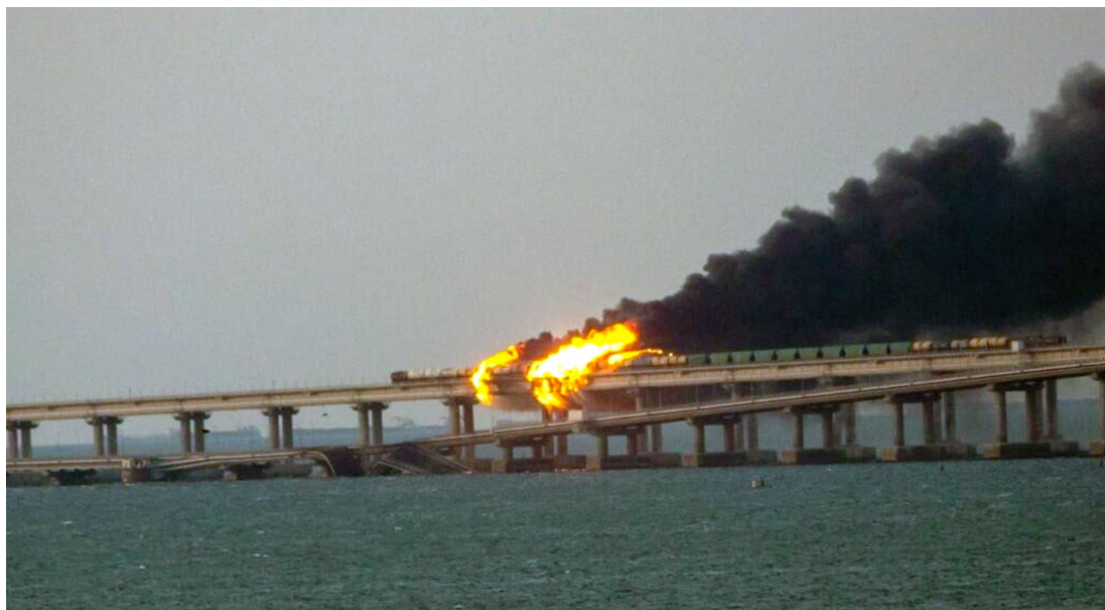
Ponte da Crimeia parcialmente destruída e em chamas após explosão.

A importante ponte que liga a Rússia à Crimeia foi atingida por uma grande explosão que derrubou uma parte da seção de pista e interrompeu o tráfego.