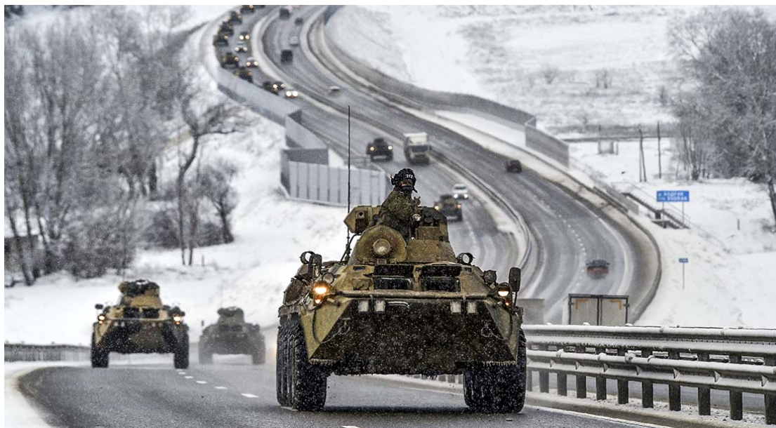
Comboio de veículos blindados russos se desloca ao longo de uma rodovia na Crimeia.

As análises da imprensa sobre o conflito na Ucrânia se baseiam em informações duvidosas, muitas vezes hipóteses transformadas em fatos, deturpando a realidade e levando a falsas conclusões. Neste extenso e bem documentado artigo, ex-oficial da inteligência suíça conduz a uma série de questionamentos.